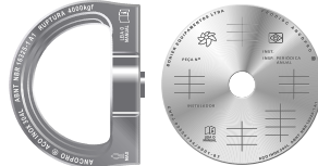
AncoPro® 360° + ProDisc CONTROLE INOX 304L Ø13mm