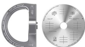
AncoPro® X360° + ProDisc CONTROLE INOX 304L Ø13mm

FIXAÇÃO: Instalação em concreto, consulte BONIER® Xtractor 20 kN